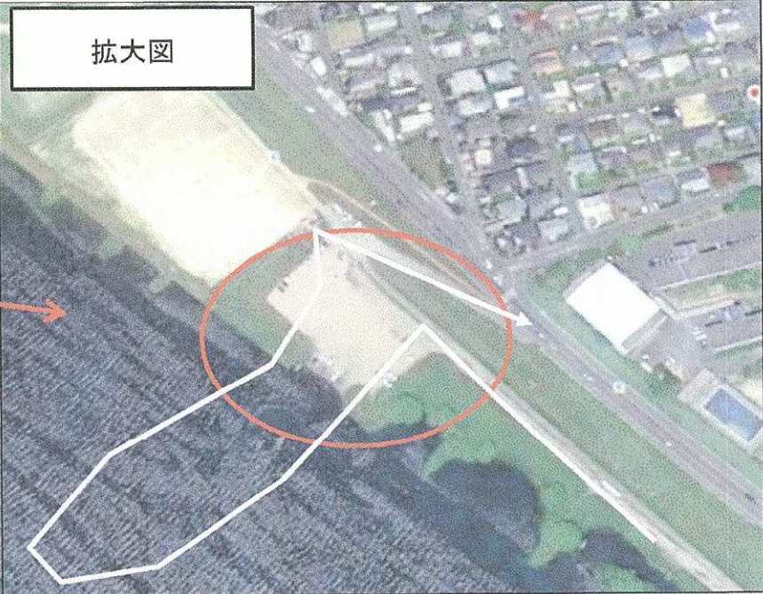
遠賀川右岸・左岸（中間市垣生付近） 及びその流域 ※上図参照